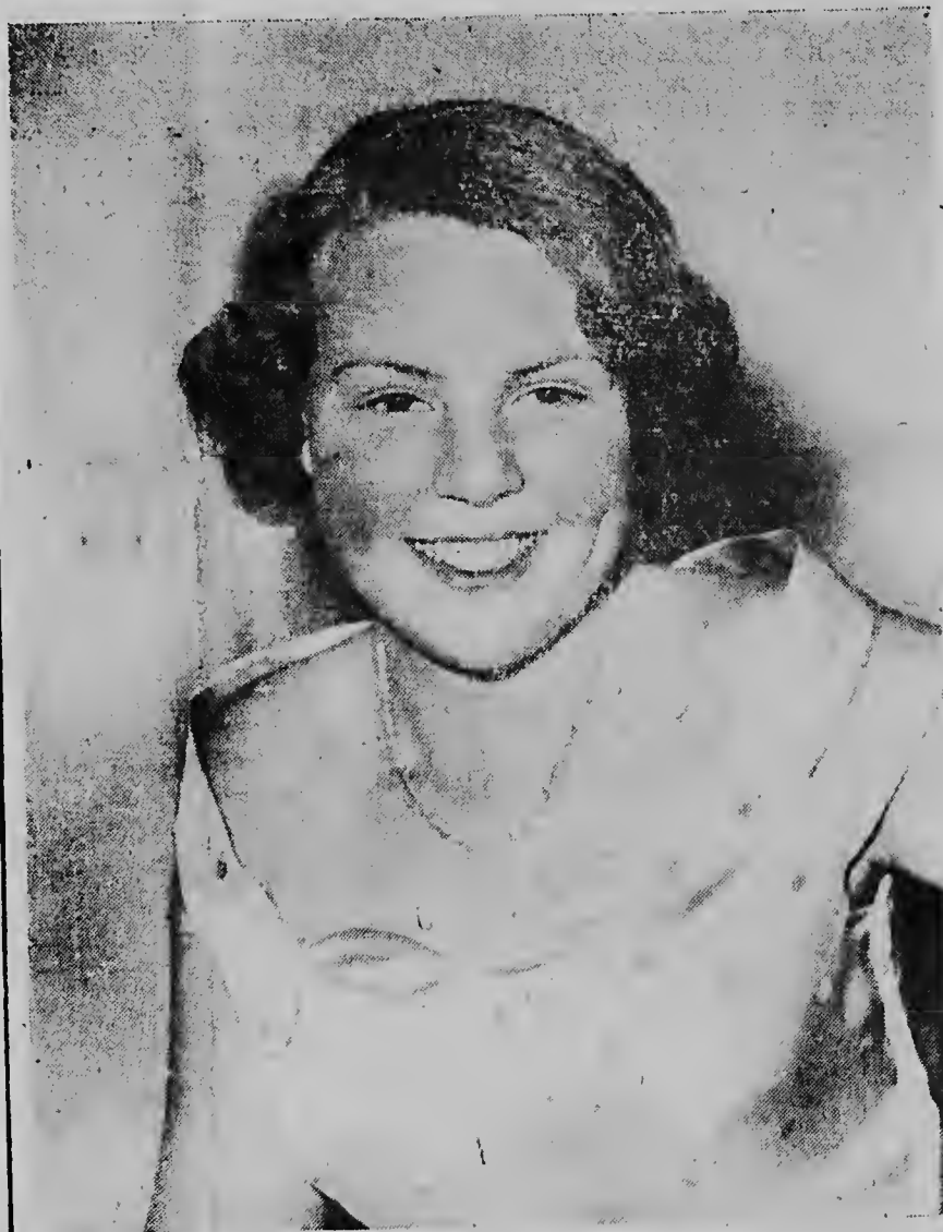
PRINCESA BEATRIX Heredera di Trono di Cas di Oranje